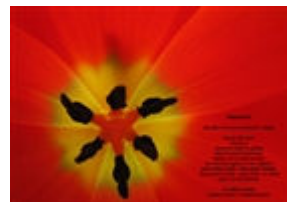
Fotopoezija s samostojne razstave maja 2007.