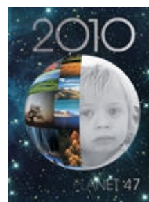
Koledar Planet 47