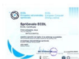
Računalniški certifikat ECDL

Kmalu po pridobitvi certifikata ECDL sem tečaj ECDL Start vodila za podjetje Agora d.o.o.